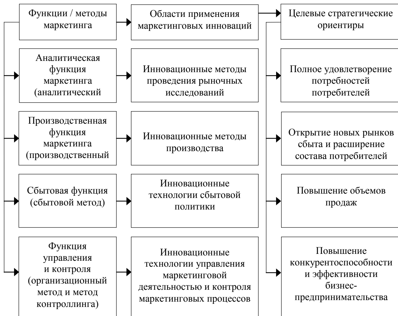
Рисунок 1 –Общая логика применения маркетинговых инноваций и их приоритеты в бизнес-предприятии