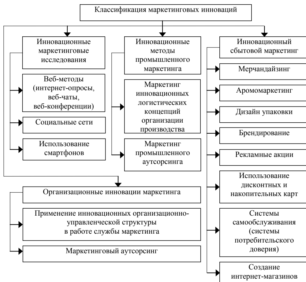
Рисунок 3 – Классификация маркетинговых инноваций

Проведенные теоретическо-методологические исследования позволяют сформировать общее системное видение всего потенциально-возможного комплекса маркетинговых инноваций. В общем виде современная классификация маркетинговых инноваций представлена в соответствии с рисунком 3.